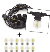
Portofino Kit Transp