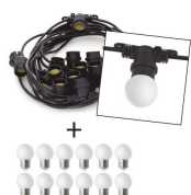
Portofino Kit Opal